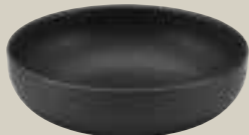
BOWL SCHWARZ 16CM BOWL BLACK 16CM BOL NOIR 16CM BOL NEGRO 16CM

ART-NR: 7 01 3112 91 000309 GRÖSSE / SIZE: Ø12cm / Ø4.7" INHALT / VOLUME: 0,33l / 11.2oz GEWICHT / WEIGHT: 233g HÖHE / HEIGHT: 3,9cm / 1.54"