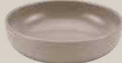
BOWL SAND 16CM BOWL SAND 16CM BOL SAND 16CM BOL SAND 16CM

ART-NR: 7 01 3112 91 000324 GRÖSSE / SIZE: Ø12cm / Ø4.7" INHALT / VOLUME: 0,33l / 11.2oz GEWICHT / WEIGHT: 233g HÖHE / HEIGHT: 3,9cm / 1.54"