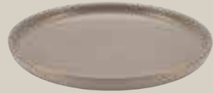
TELLER FLACH SAND 22CM PLATE FLAT SAND 22CM ASSIETTE PLATE SAND 22CM PLATO NEGRO SAND 22CM

ART-NR: 7 01 1222 91 000324 GRÖSSE / SIZE: Ø22cm / Ø8.6" GEWICHT / WEIGHT: 583g HÖHE / HEIGHT: 2,6cm / 1.02"