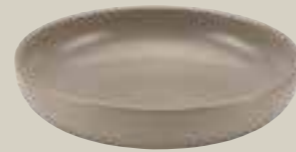
BOWL SAND 22CM BOWL SAND 22CM BOL SAND 22CM BOL SAND 22 CM

ART-NR: 7 01 3116 91 000324 GRÖSSE / SIZE: Ø16cm / Ø6.3" INHALT / VOLUME: 0,60l / 20.3oz GEWICHT / WEIGHT: 329g HÖHE / HEIGHT: 3,8cm / 1.5"