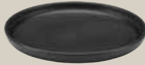
TELLER FLACH SCHWARZ 22CM PLATE FLAT BLACK 22CM ASSIETTE PLATE NOIR 22CM PLATO NEGRO PLANO 22CM

ART-NR: 7 01 1222 91 000309 GRÖSSE / SIZE: Ø22cm / Ø8.6" GEWICHT / WEIGHT: 583g HÖHE / HEIGHT: 2,6cm / 1.02"