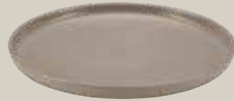
TELLER FLACH SAND 28CM PLATE FLAT SAND 28CM ASSIETTE PLATE SAND 28CM PLATO NEGRO SAND 28CM

ART-NR: 7 01 1222 91 000324 GRÖSSE / SIZE: Ø22cm / Ø8.6" GEWICHT / WEIGHT: 583g HÖHE / HEIGHT: 2,6cm / 1.02"