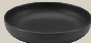
BOWL SCHWARZ 22CM BOWL BLACK 22CM BOL NOIR 22CM BOL NEGRO 22 CM

ART-NR: 7 01 3116 91 000309 GRÖSSE / SIZE: Ø16cm / Ø6.3" INHALT / VOLUME: 0,60l / 20.3oz GEWICHT / WEIGHT: 329g HÖHE / HEIGHT: 3,8cm / 1.5"