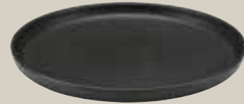
TELLER FLACH SCHWARZ 28CM PLATE FLAT BLACK 28CM ASSIETTE PLATE NOIR 28CM PLATO NEGRO PLANO 28CM

ART-NR: 7 01 1222 91 000309 GRÖSSE / SIZE: Ø22cm / Ø8.6" GEWICHT / WEIGHT: 583g HÖHE / HEIGHT: 2,6cm / 1.02"