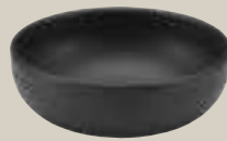
BOWL SCHWARZ 12CM BOWL BLACK 12CM BOL NOIR 12CM BOL NEGRO 12CM

ART-NR: 7 01 3112 91 000309 GRÖSSE / SIZE: Ø12cm / Ø4.7" INHALT / VOLUME: 0,33l / 11.2oz GEWICHT / WEIGHT: 233g HÖHE / HEIGHT: 3,9cm / 1.54"