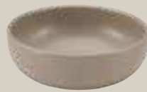
BOWL SAND 12CM BOWL SAND 12CM BOL SAND 12CM BOL SAND 12CM

ART-NR: 7 01 6900 91 000324 GRÖSSE / SIZE: Ø11,7cm / Ø4.6" GEWICHT / WEIGHT: 161g HÖHE / HEIGHT: 1,7cm / 0.67"